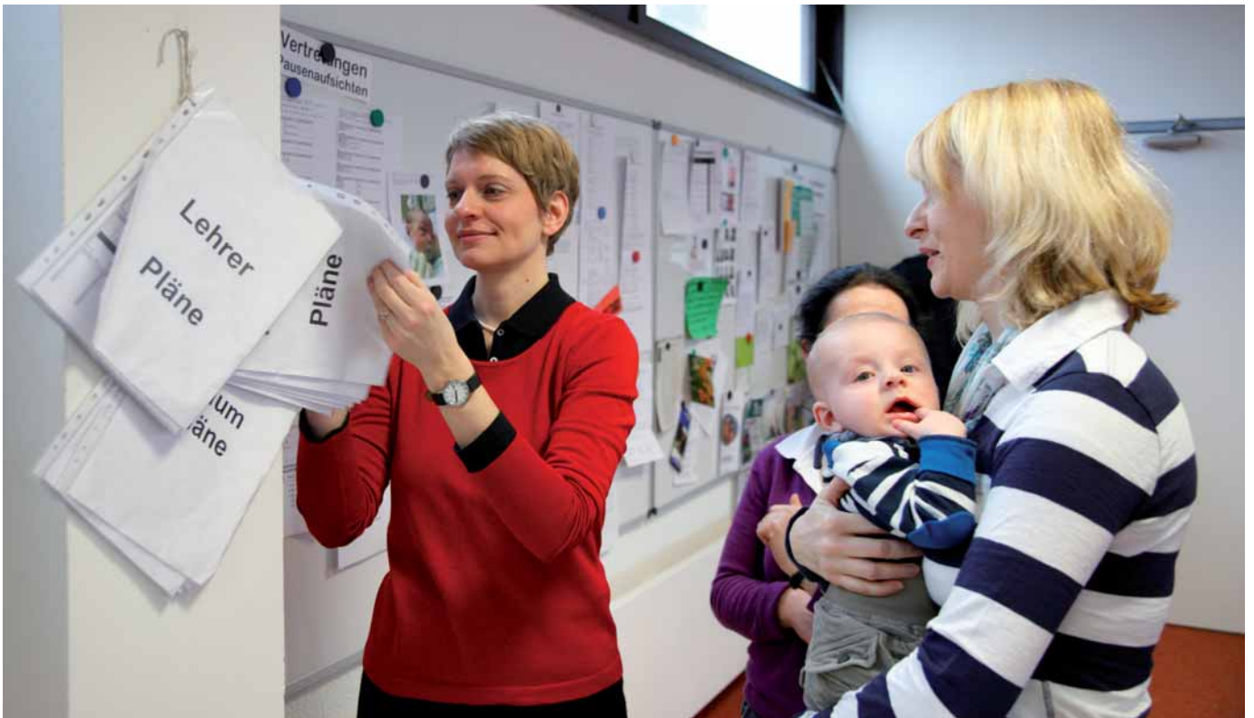
Gesundheitsberatung durch erfahrene Ärztinnen und Ärzte

plätze im Berufskolleg wird durch B·A·D-Sicherheitsfachkräfte mit den interessierten Lehrkräften durchgeführt und diese zur ergonomischen Gestaltung ihrer Arbeitsplätze beraten.