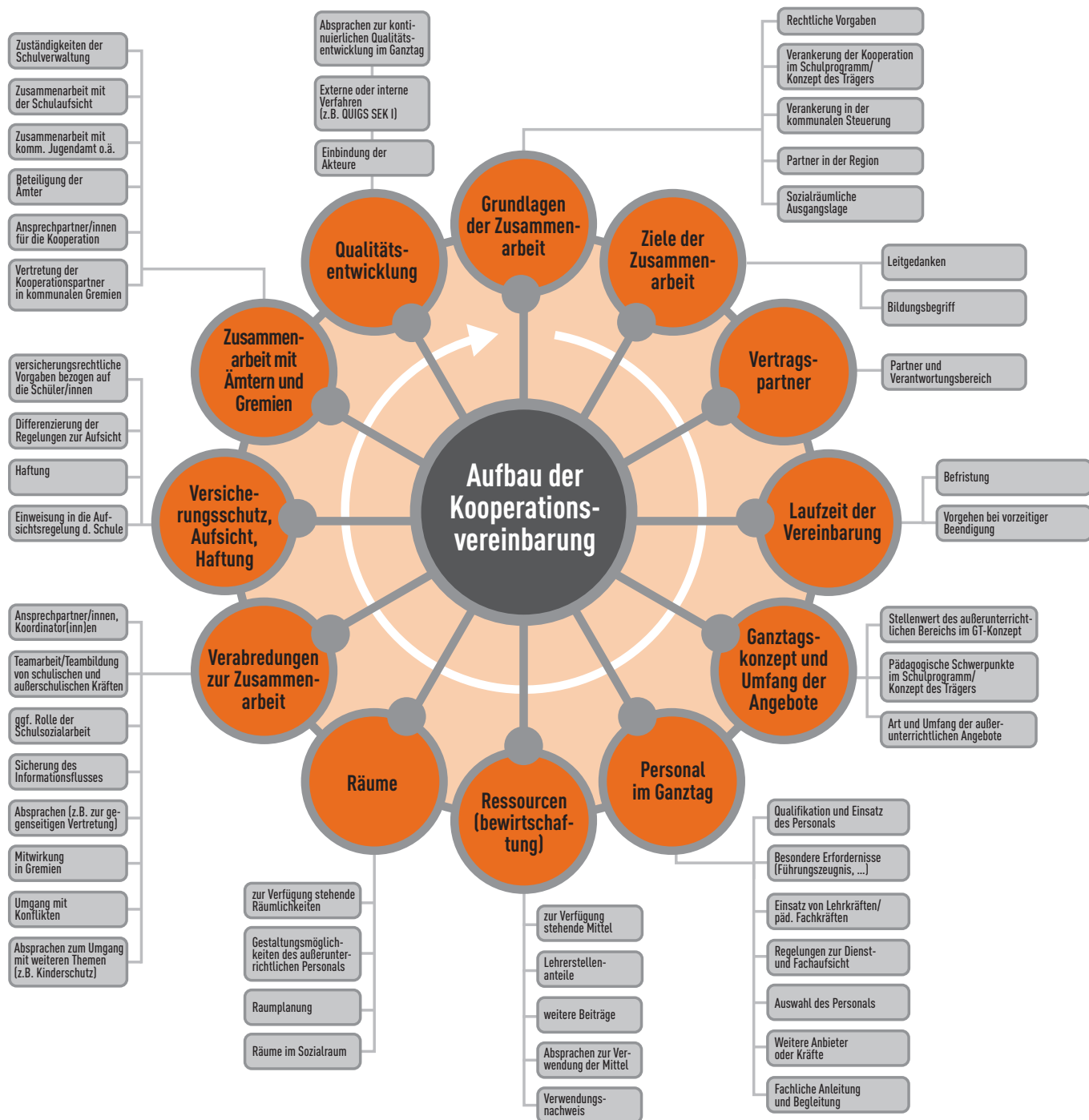
Abb. 2: Zentrale Themenbereiche der Kooperationsvereinbarung