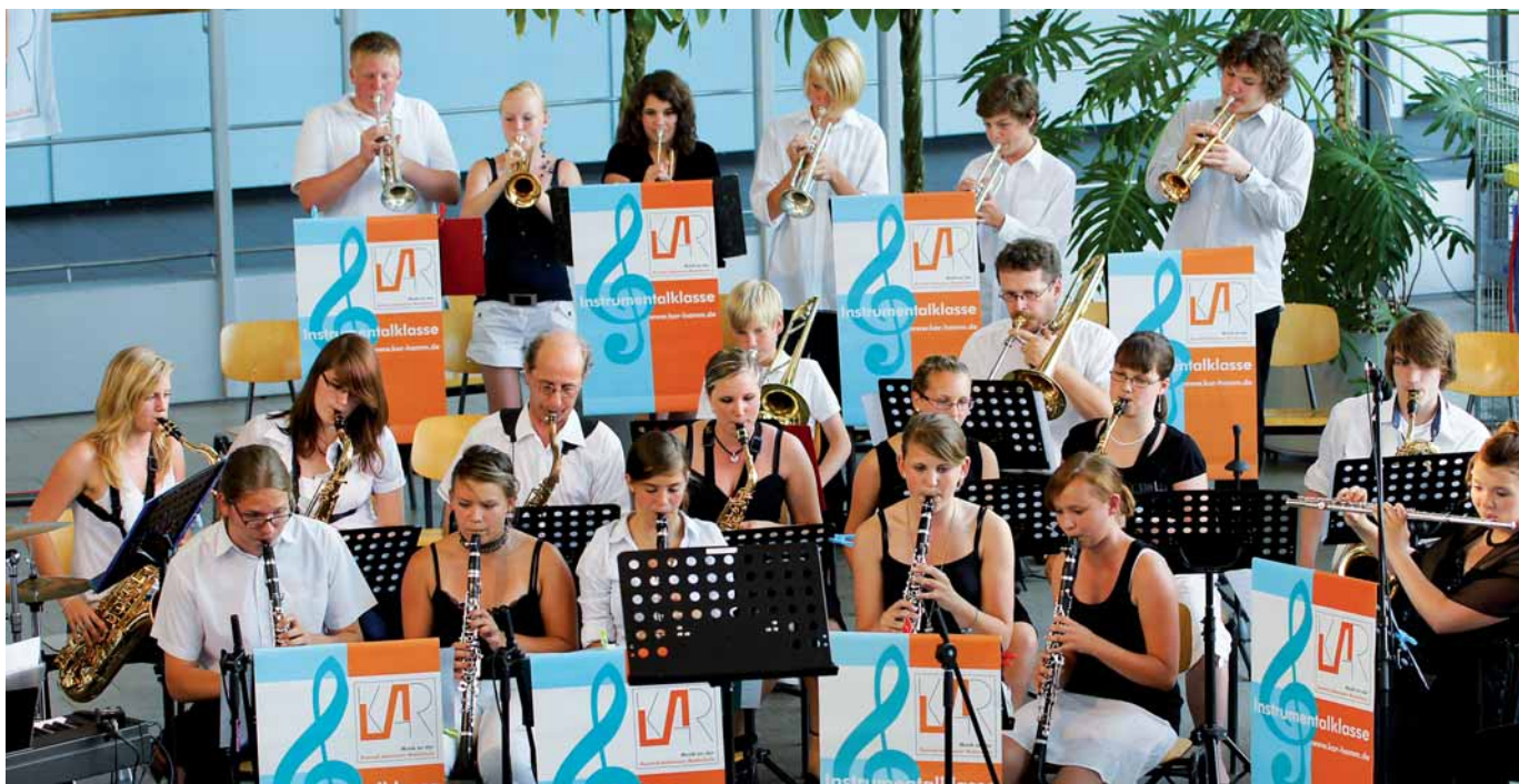
Bigband spielt zur Abschlussfeier

An der KAR hat sich über die Jahre ein Förderkonzept bewährt, das neben dem „klassischen Förderunterricht“ auch den Einsatz von Tutorinnen und Tutoren vorsieht, die aus den oberen Klassen oder regelmäßig von einem Berufskolleg in die Schule kommen. Die Schülerinnen und Schüler werden altersgerecht zu selbstständigem Lernen angehalten. Bibliothek und Mediothek liefern als „Selbstlernzentrum“ gute Arbeitsvoraussetzungen.