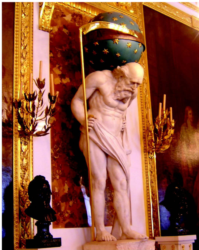
Guter Rat ist teuer

Schließlich ist auf den fast selbstverständlichen Umstand hinzuweisen, dass Beratung im Wesentlichen in Gesprächen besteht. Das drückt sich bereits im Begriff aus (Rat und Rede sind wahrscheinlich gleichen ethymologischen Ursprungs), erweist sich aber auch als übereinstimmendes Merkmal in verschiedensten Beratungstheorien.