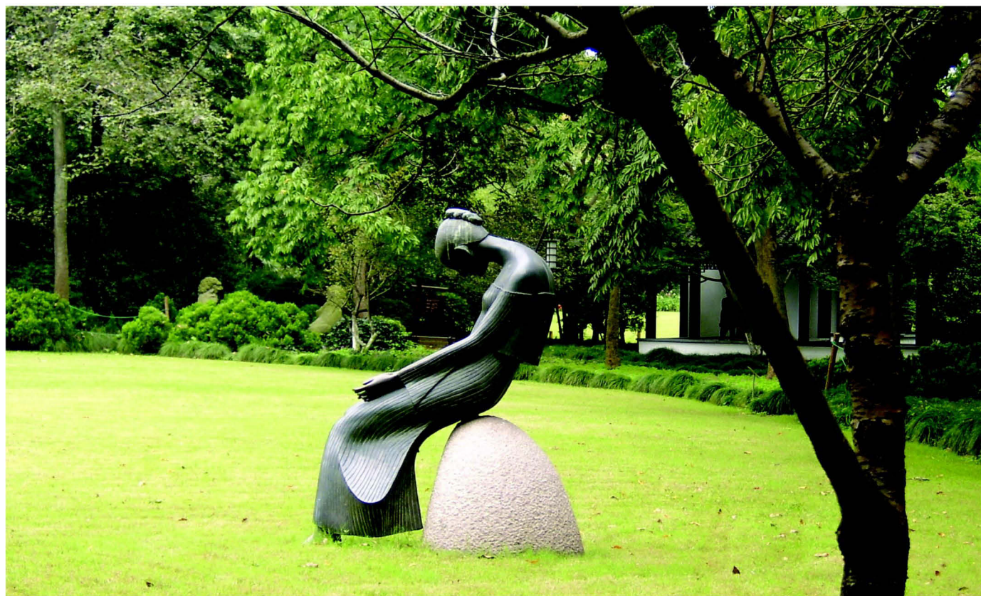
Ratlos im Grünen?

Beratung beruht also auf einer Struktur (Klient – Gegenstand – Berater) und einer Aufgabe oder Funktion (Strategie-