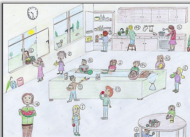
a) Bild „Breakfast in school“