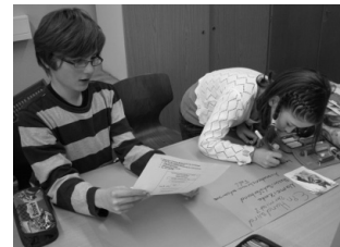
Kinder bei der Überarbeitung