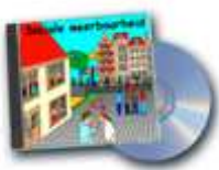
Cd-rom sociale weerbaarheid