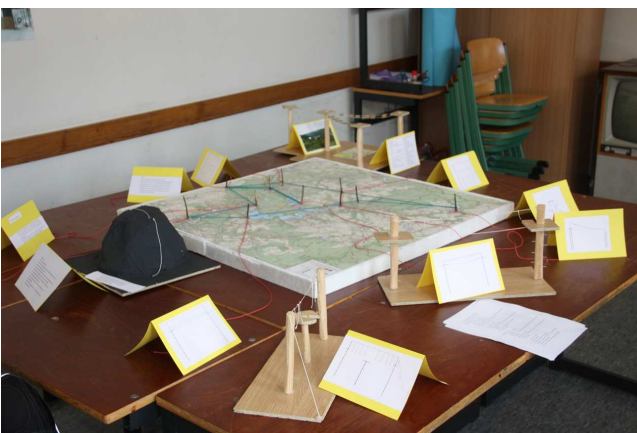
Modell der Kletterpark-Anlage mit Konstruktionszeichnungen der Kletterstationen und Info-Tafeln zur 3. Dimension des Nationalparks