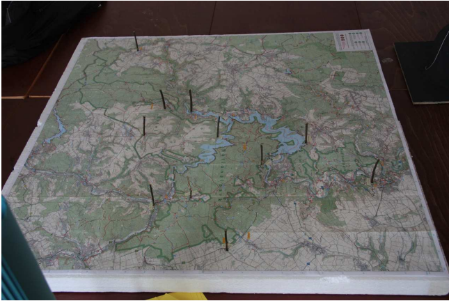
Der Nationalpark Eifel im Kartenbild mit den möglichen Standorten der Kletterstationen