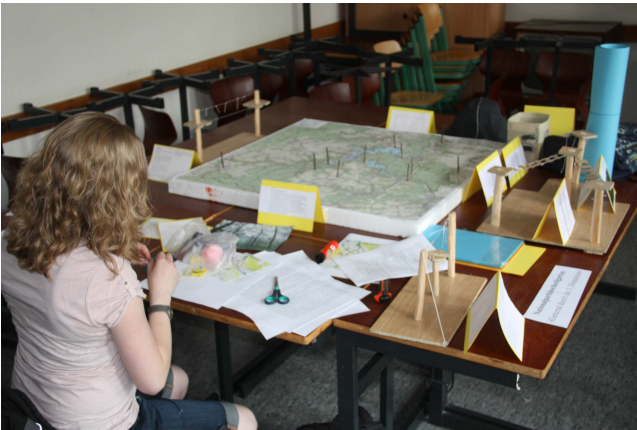
Letzte Vorbereitungen für die Präsentation