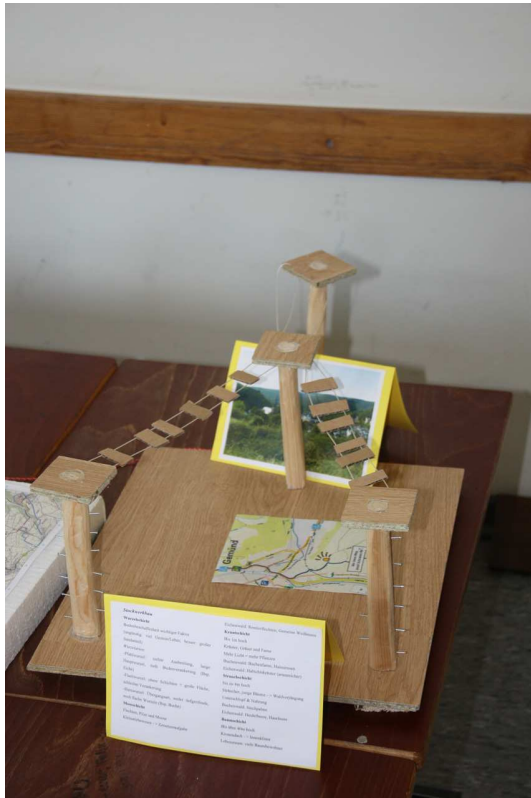
Kletterstations-Modell mit Erläuterungstext, Standortfoto und Kartenausschnitt