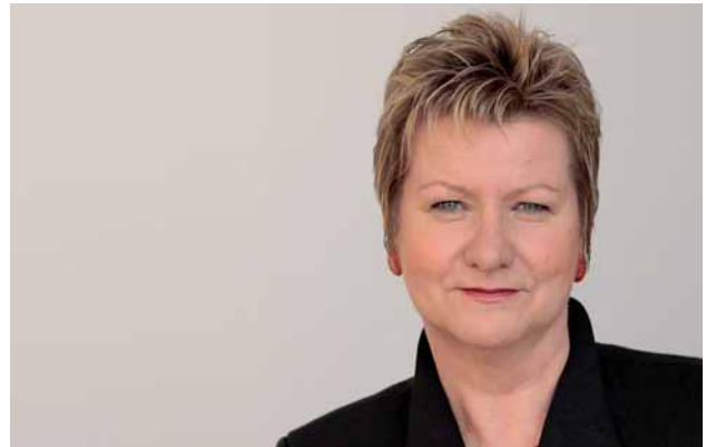
Sylvia Löhrmann, Ministerin für Schule und Weiterbildung

Ziel der Überarbeitung war es, die Ausbildung im Vorbereitungsdienst unter dem Blickwinkel »Lernen und Lehren in einer Schule der Vielfalt« mit einem weiten Inklusionsbegriff zu stärken. Die wohl sichtbarste Veränderung in der Umsetzung dieser Anforderung stellt die Neuausrichtung des bisherigen Handlungsfeldes 5 »Vielfalt...« hin zu einer allen Handlungsfeldern unterlegten Leitlinie »Vielfalt als Herausforderung annehmen und als Chance nutzen« dar. Damit wird der wegweisende Paradigmenwechsel in der schulpraktischen Ausbildung konsequent verankert. Die Gleichwertigkeit der weiteren Handlungsfelder wird durch ihre jeweils neuen Bezeichnungen unterstrichen, und die zentralen Querschnittsthemen erfordern deren enge Vernetzung, was sich in den exemplarischen Handlungssituationen und Erschließungsfragen abbildet. Die Querschnittsthemen sind integraler Bestandteil der Ausbildung in allen Fächern und